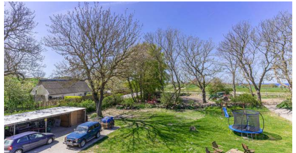
Carport / Garten