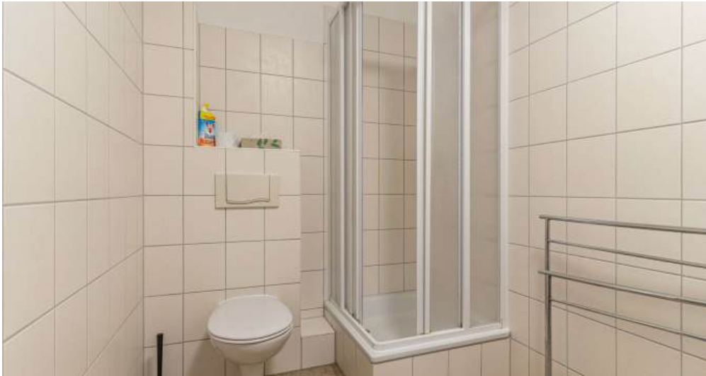
Fewo 5 - Bad