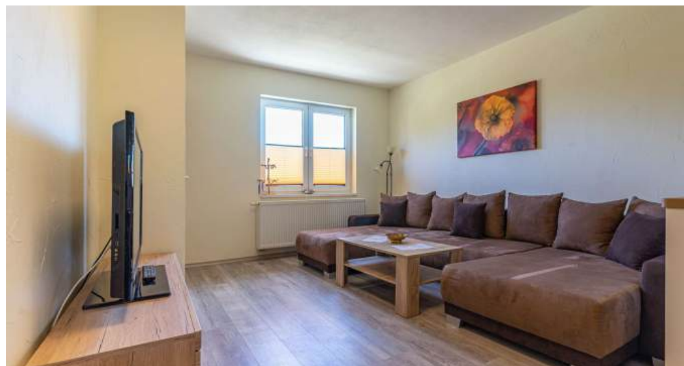
Fews 5 - Wohnzimmer