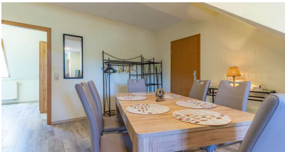
Fews 5 - Küche