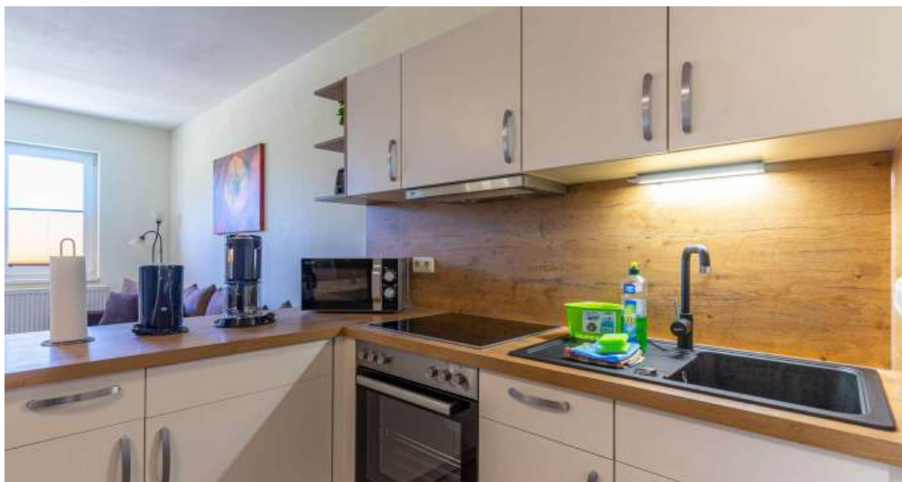
Fews 5 - Küche