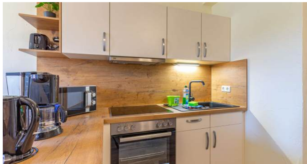
Fews 5 - Küche