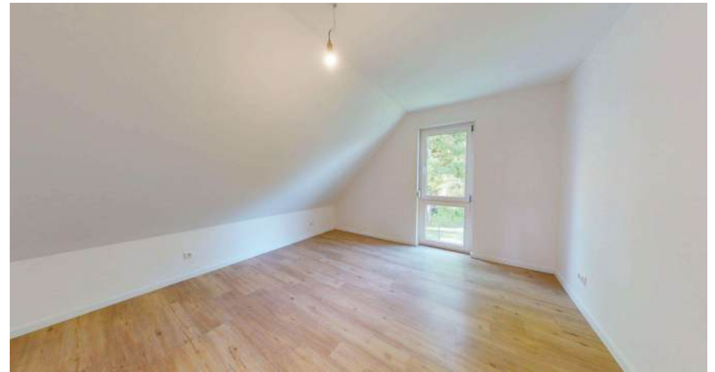
Schlafzimmer - OG