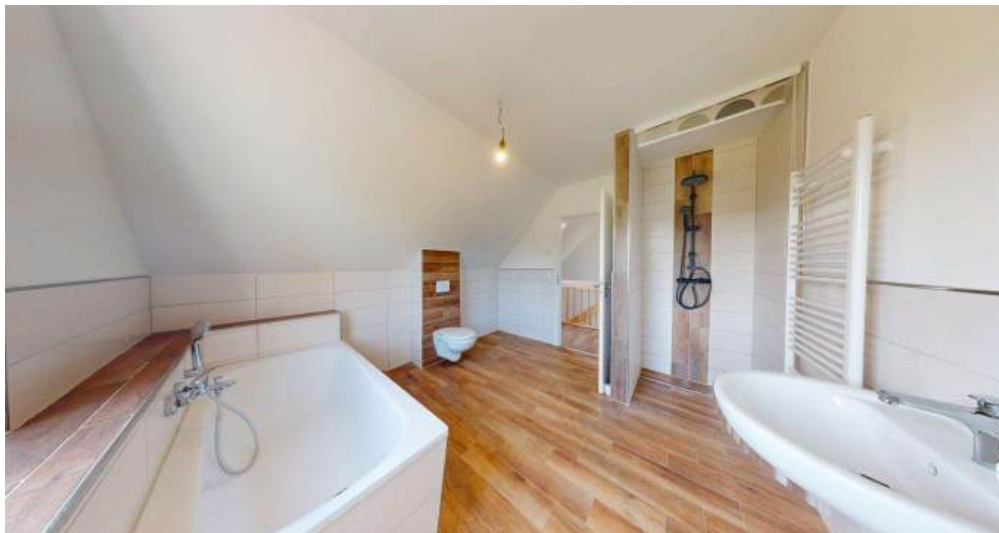
Badezimmer - OG