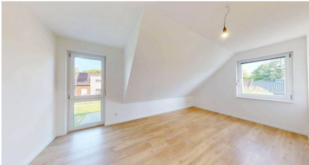
Kinderzimmer 2 - OG