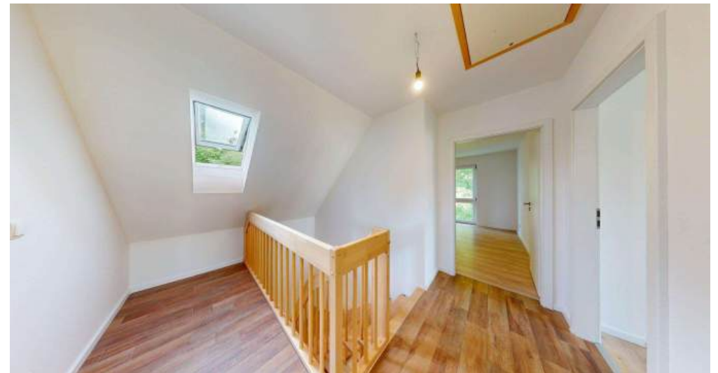
Flur - OG